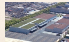
福山ピッキングセンター全景

向上に繋がります。また、屋上には緑化システムを採用し、断熱効果による省エネ設備となっています。