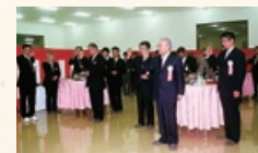
福山ピッキングセンター竣工式