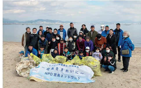
宮島ネットワーク様