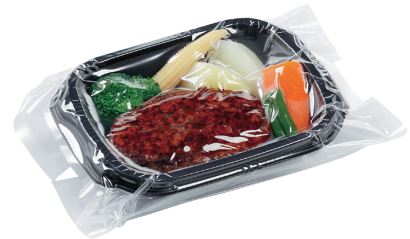
容器と軟包材（三方袋）のセット