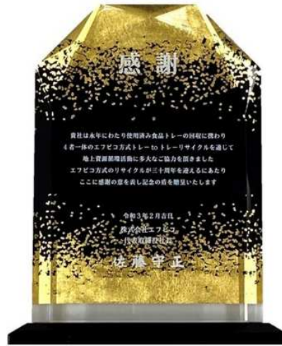
(感謝の盾 メッセージ)

貴社は永年にわたり使用済み食品トレーの回収に携わり 4者一体のエフピコ方式トレー to トレーリサイクルを通じて 地上資源循環活動に多大なご協力を頂きました エフピコ方式のリサイクルが三十周年を迎えるにあたり ここに感謝の意を表し記念の盾を贈呈いたします