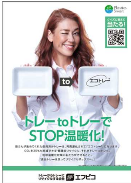
(※3) リサイクル推進ポスター及びステッカー