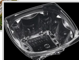
エコ透明容器 (ボトル to 透明容器)