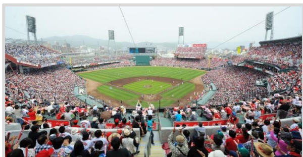
MAZDA Zoom-Zoom スタジアム広島