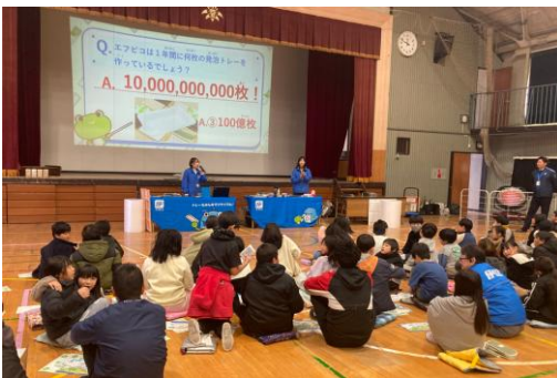
小学校での環境出前授業

これらの活動を通じて、エフピコと小売企業は地域社会全体でリサイクルへの理解を深め、持続可能な社会の実現を目指してまいります。