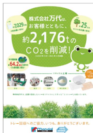
「エコストア協働宣言ポスター」