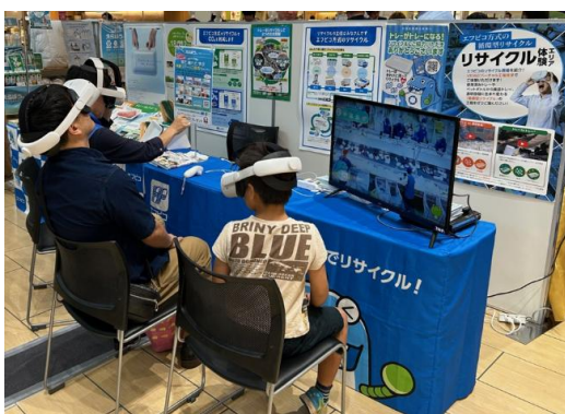
店舗での環境学習イベントの様子