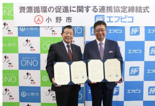
自治体との連携協定締結式の様子