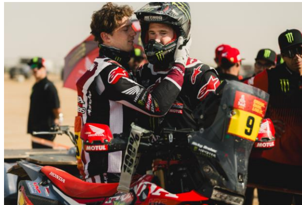
Dakar Rally 2026 写真②

今回搭載される「FORTENA」は、新OPPシート「OPTENA(オプテナ)」を積層した二軸延伸ポリプロピレンプレートであり、協業機械メーカーでの生産品を使用しています。既存品(ポリカーボネート製)に比べ以下の優れた特性が評価され、採用に至りました。