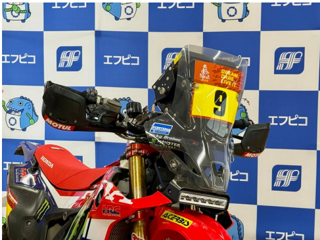
ウインドスクリーンに「FORTENA」を搭載したラリーレイド用二輪車