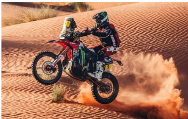
Dakar Rally 2026 写真①

今後、スポンサード契約期間中に開催される世界ラリーレイド選手権(W2RC)5レースにおいて、当社の新素材「FORTENA(フォルテナ)」製ウインドスクリーンを搭載した HRC のラリーレイド用二輪車「CRF450 Rally」が参戦する予定です。先行的な取り組みとして、2026年1月に開催された「Dakar Rally 2026」において「CRF450 Rally」に「FORTENA」製ウインドスクリーンが初搭載されました。